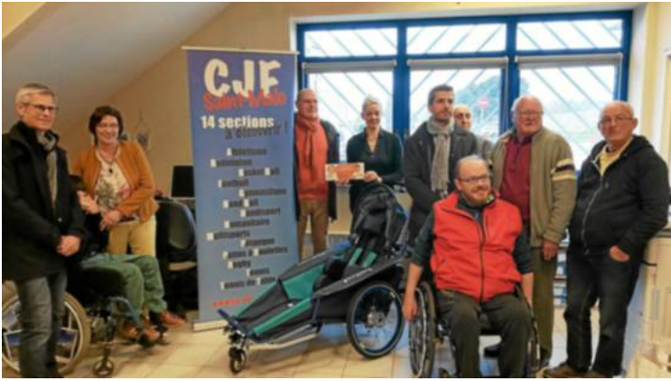
Les partenaires privés étaient présents vendredi, pour la réception du nouveau fauteuil hippocampe de la section handisport.

Inaugurée vendredi, en fin d'après-midi, dans les locaux de l'association, la nouvelle monture du Cercle Jules-Ferry (CJF) permettra aux enfants et adolescents porteurs de handicap moteur de participer à des courses jusque-là inaccessibles pour eux. « L'hippocampe ne nécessite qu'un bénévole qui pilote depuis l'arrière, contre quatre voire cinq ou six pour une joëlette que nous possédons déjà. Cela nous permettra d'avoir davantage de représentants handisports sur les courses de la région », expliquent les responsables du Cercle.