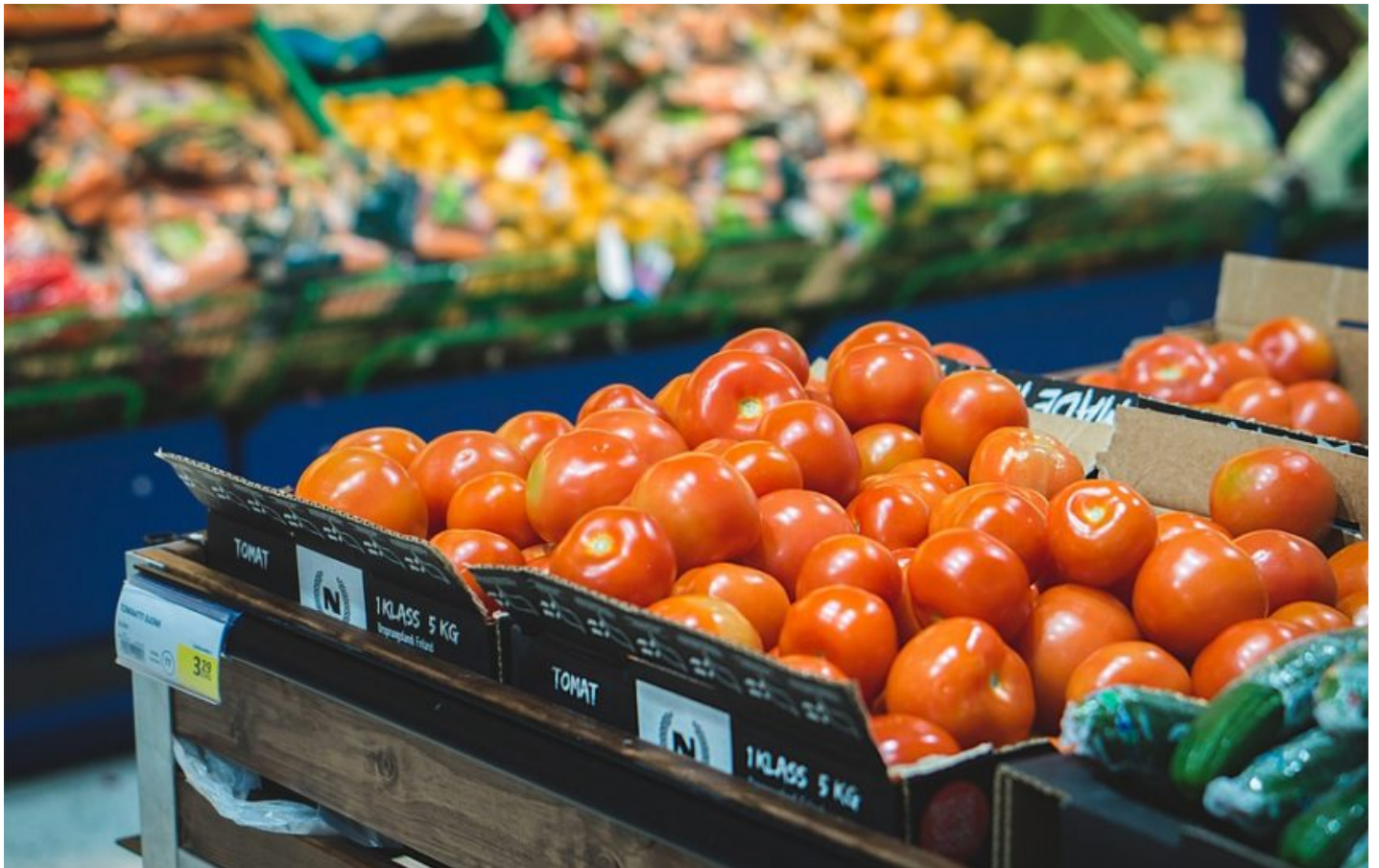
L'épicerie solidaire distribuera très prochainement des produits frais, en fonction des arrivages de la Banque Alimentaire.

« On va peut-être aussi changer nos horaires pour s'adapter davantage à ceux des étudiants ».